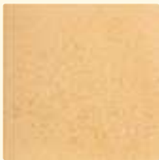
215 ocker mittel