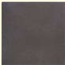
432 cacao mittel