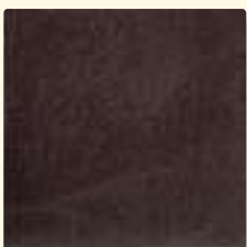
433 cacao dunkel