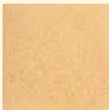
215 ocker mittel