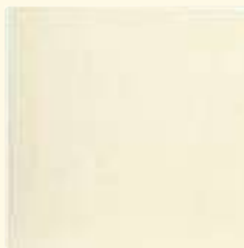
461 alabaster matt