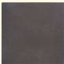
432 cacao mittel