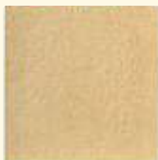
436 sandstein mittel